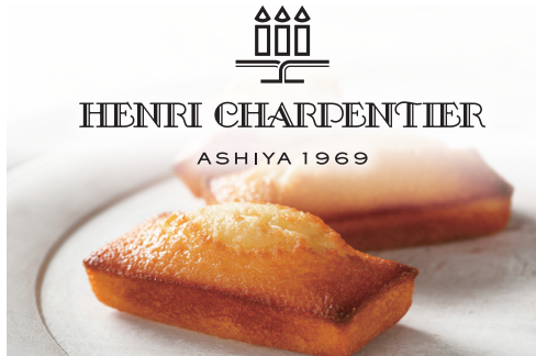
販売個数 世界一のギネス世界記録®を7度も達成した同社のフィンランシェ